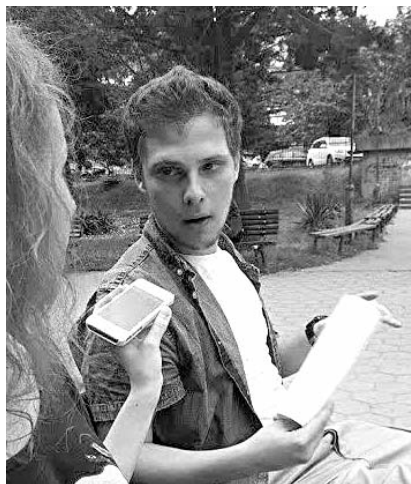
Продолжение од стр. 1

МЕДИУМ: Каков впечаток ти остави режисерот?