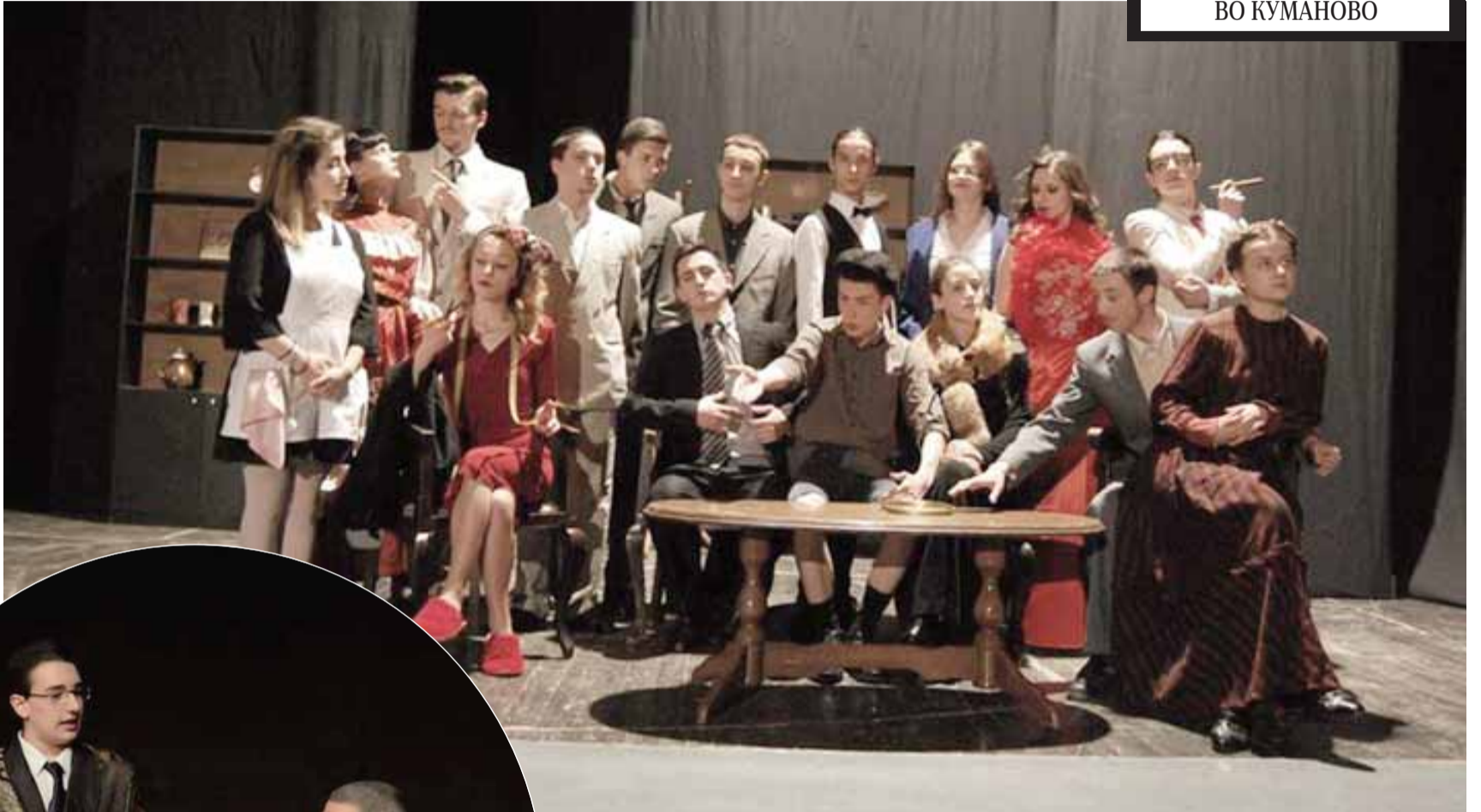
Драмската училишна секција