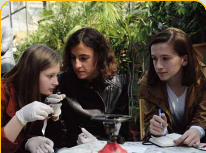
Младите од кумановско Слупчане рекоа дека во нивното село босилекот се користи како средство против комарци, кој има и добар мирис. Исто така и дека камилицата се користи како чај, но и како крем за лице.

Како да ги употребуваме растенијата за кожата на телото, за зголемување на очните трепки или против комарци, но и како да ги користиме како природни лекови. На работилницата за млади во Ботаничката градина во Гази Баба, околу 20 тинејџери учеа за карактеристиките, ефектите и придобивките од различни видови растенија кои растат во Македонија и како можеме самите да ги користиме во секојдневниот живот. Работилниците за млади и деца се организираат во Ботаничката градина до крајот на мај од Институтот за биологија, Македонското биолошко друштво и Институтот за комуникациски студии како дел од кампањата за подобра животна средина „Не игнорирај! Реагирај!“.