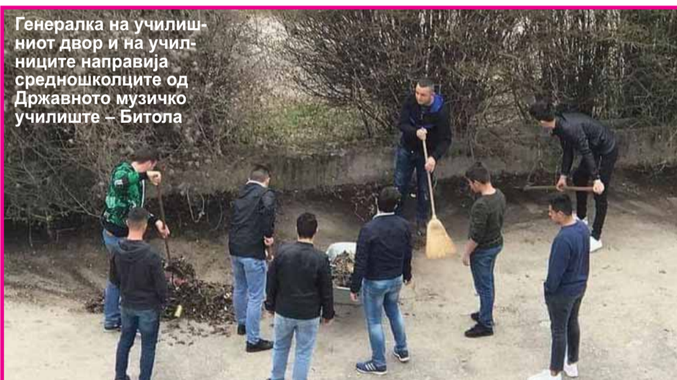
Генералка на училишниот двор и на училишните направија средношколците од Државното музичко училиште – Битола