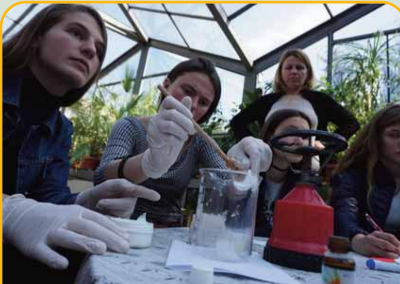
Како дел од работилницата за изработка на природни козметички производи, која е наменета за млади над 13 години, тие учеа како се прави природен козметички производ.