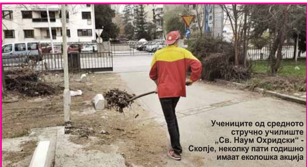
Учениците од средното стручно училиште „Св. Наум Охридски“ - Скопје, неколку пати годишно имаат еколошка акција