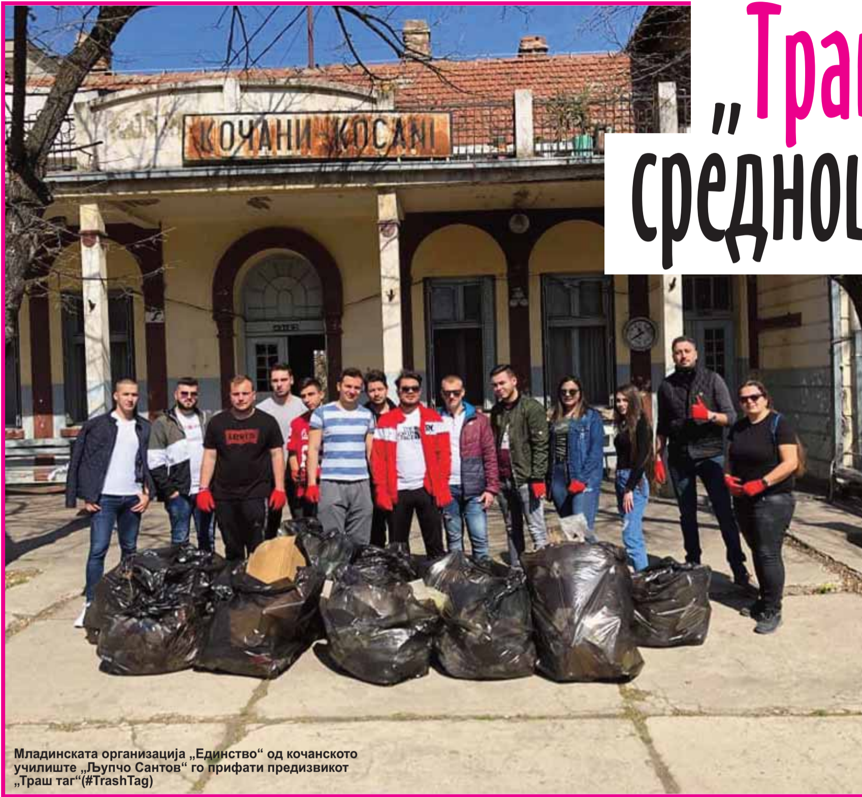
Младинската организација „Единство“ од кочанското училиште „Љупчо Сантов“ го прифати предизвикот „Траш таг“ (#TrashTag)