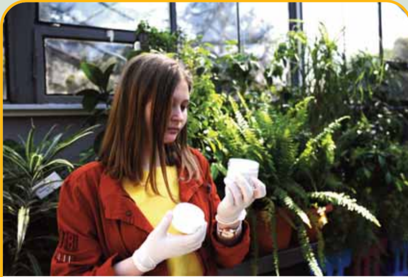
Тинејџерите рекоа дека слушнале дека кантарионот може да се користи како масло за тело, дека зелениот чај се пие за слабеење, а дека ориганото, освен како зачин, може да се користи и како козметичко средство за зголемување на очните трепки. Но досега не забележале дали овие растенија растат во местото каде што живеат и кои се нивните карактеристики.