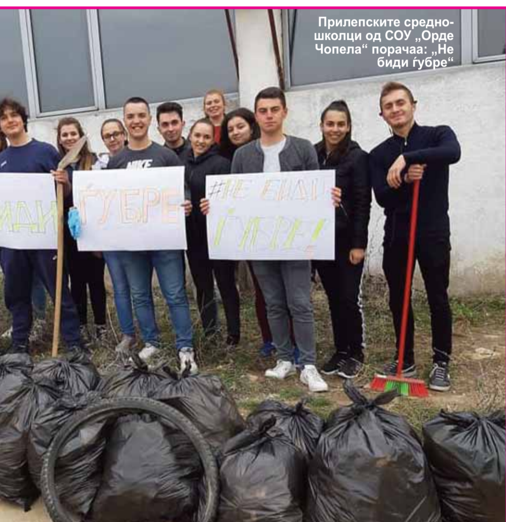
Прилепските средношколци од СОУ „Орде Чопела“ порачаа: „Не биди губре“